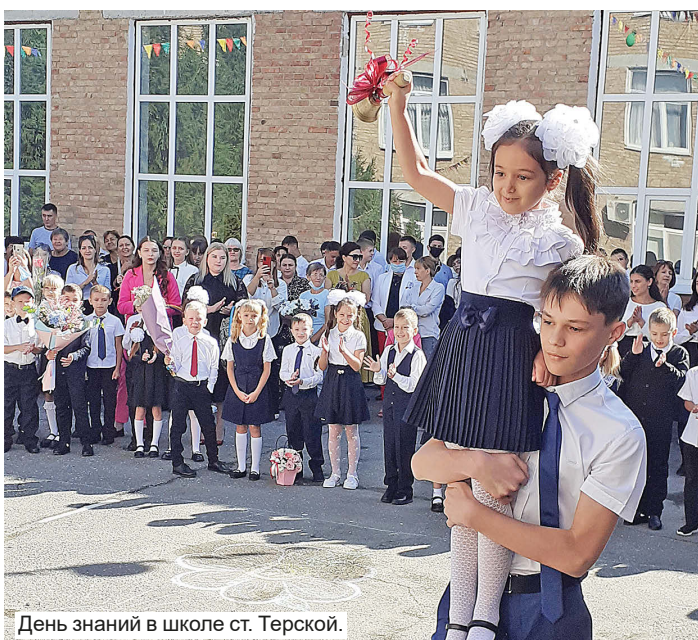
День знаний в школе ст. Терской.

В каждой из 29 образовательных организаций Моздокского района в качестве гостей были представители органов власти - главы, депутаты. Глава Моздокского